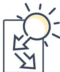
Résistance à la lumière UNI EN 15187