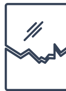
Adhésion pour test aux déchirures UNI EN 13144