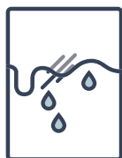
Adhésion à la surface humide test de laboratoire Renner