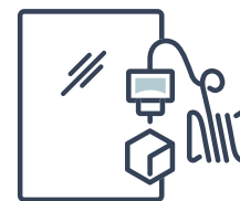
Tension de surface test de laboratoire Renner