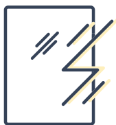
Résistance aux rayures UNI EN 15186