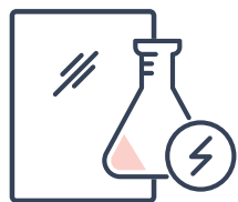
Résistances chimiques UNI EN 12720