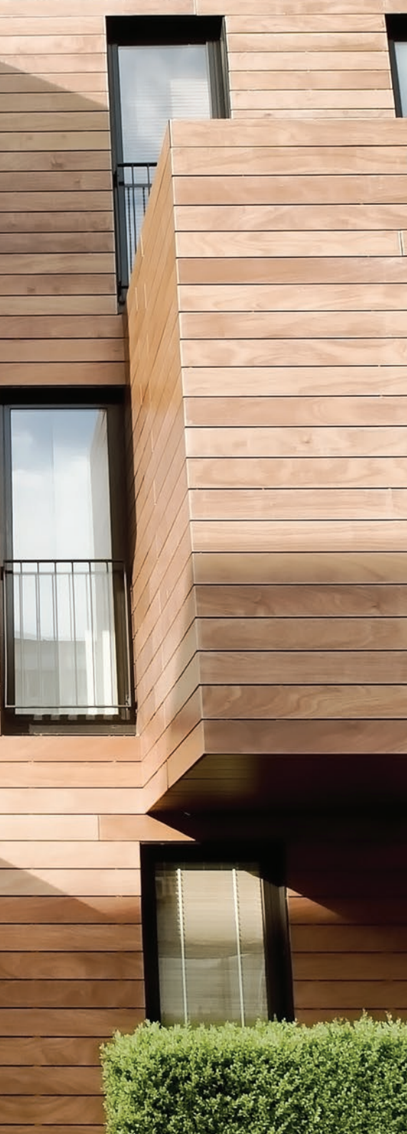
Volets (détail): 4,5 ans à l'extérieur.